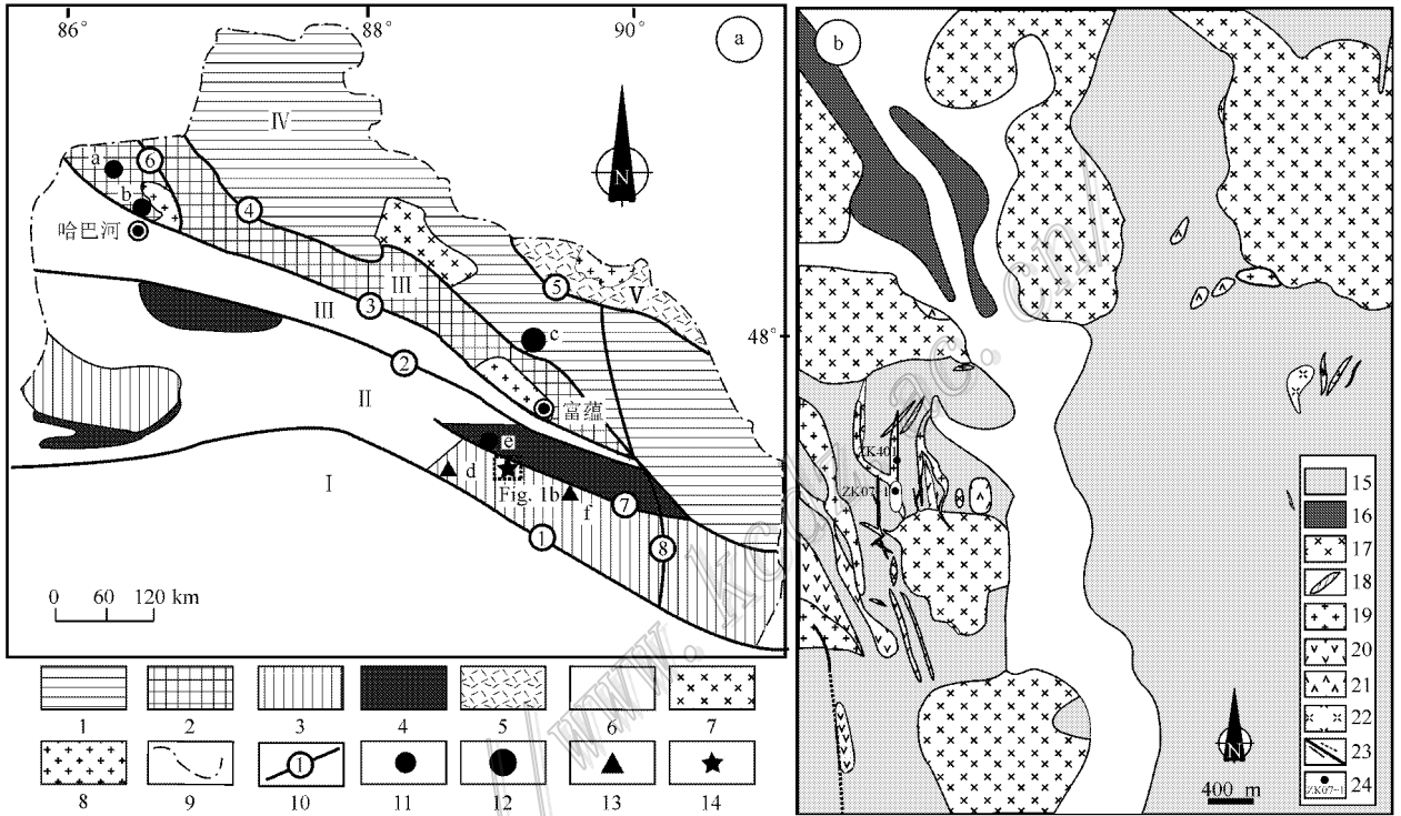
图 1 东准噶尔北部地质构造略图(a)据沈远超等,2007;陈华勇等,2000 改绘和希勒库都克铜钼矿区地质图(b) ① 1—寒武纪—石炭纪变质复理石建造;2—泥盆纪细碧角闪岩建造;3—泥盆纪火山岩和火山碎屑岩;4—石炭纪火山岩和火山碎屑岩;5—泥盆纪—石炭纪火山沉积岩;6—第四纪沉积物;7—早古生代花岗岩;8—晚古生代花岗岩;9—国界;10—断裂及编号;11—金矿床;12—稀有金属矿床;13—铜矿床;14—研究区;15—石炭系凝灰质砂岩、粉砂岩;16—第三系红色黏土岩、泥岩、粉砂质泥岩;17—花岗闪长岩;18—花岗岩;19—花岗斑岩;20—石英闪长岩;21—安山玢岩;22—石英正长岩;23—断层;24—钻孔及编号。构造单元:Ⅰ—乌伦古海沟;Ⅱ—萨吾尔—阿尔曼太岛弧;Ⅲ—克兰弧后盆地;Ⅳ—可可托海岩浆弧;Ⅴ—诺尔特断陷盆地。断裂:①—乌伦古;②—额尔齐斯;③—哈巴河;④—玛因鄂博;⑤—红山嘴;⑥—玛儿卡库里;⑦—萨尔布拉克;⑧—二台断裂。矿床:a—多拉纳萨依金矿床;b—赛都金矿床;c—可可托海伟晶岩型稀有金属矿床;d—索尔库都克 Cu-Mo 矿床;e—萨尔布拉克金矿床;f—喀拉通克 Cu-Ni 矿床

希勒库都克铜钼矿床位于准噶尔板块北缘,介于 NWW 向额尔齐斯断裂和乌伦古断裂之间(图 1)。额